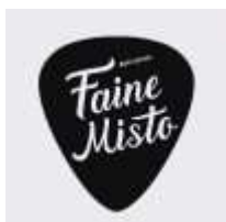
Міжнародний музичний фестиваль “Faine Misto Festival”

Народний депутат України, перший заступник голови комітету з питань організації державної влади, місцевого самоврядування, регіонального розвитку та містобудування. Матрос ЗСУ.